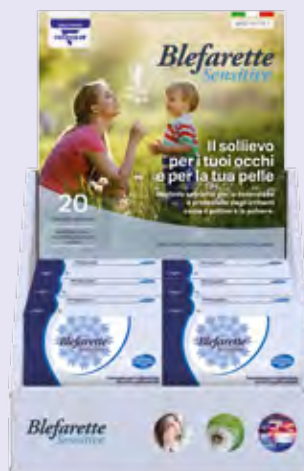
Espositore da banco Ingombro L28cm - A36cm - P17cm Contiene: 6 confezioni Blefarette Sensitive