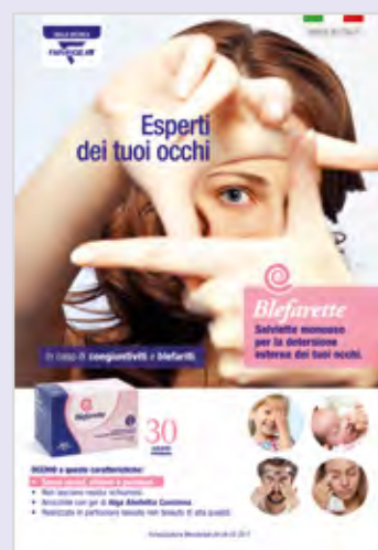
Cartello vetrina misure 45x65cm