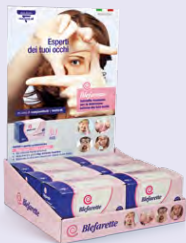
Espositore da banco Ingombro L28cm - A42cm - P27cm Contiene: 6 confezioni Blefarette