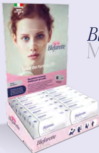
Espositore da banco Ingombro L28cm - A42cm - P19cm Contiene: 12 confezioni Blefarette Mask